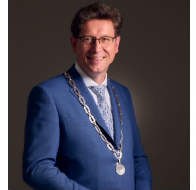
Roger de Groot burgemeester Noordoostpolder