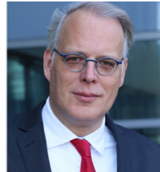
Roland de Kruijk, gebiedsofficier van justitie